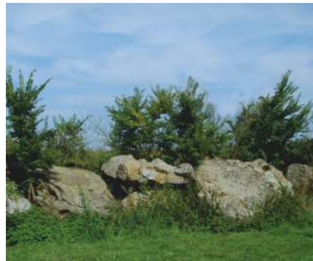
La Ville Génouhan (Créhen)